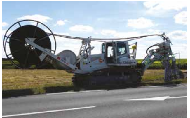
Engin de travaux publics servant à déployer les câbles contenant la fibre.

Il faut bien le dire, le chantier est titanesque ! Gironde Numérique, via son plan Gironde Haut Méga, s'est engagé à raccorder, en 6 ans de 2018 à 2024, l'ensemble des foyers du département, soit plus de 460 000 dans le cadre de 1400 chantiers. Voilà pourquoi cela prend du temps ! Le chantier consiste à faire arriver la fibre optique jusqu'aux abords des maisons, par des travaux souterrains. Des fourreaux sont installés et on passe la fibre à l'intérieur jusqu'à des armoires de mutualisation.