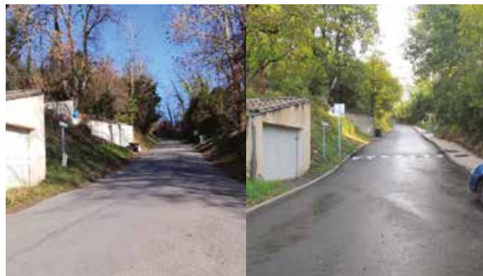
Vues de la côte du Carat avant et après les travaux d'aménagement et de sécurisation.

Comme annoncée, une aire de jeux pour enfants a été créée à Damluc, rue Villa Pauline. Le site, clôturé et sécurisé, est réservé aux familles et aux enfants. Une boîte à livres et une table viendront compléter l'équipement. Une installation qui s'est faite en concertation avec les assistantes maternelles du quartier.