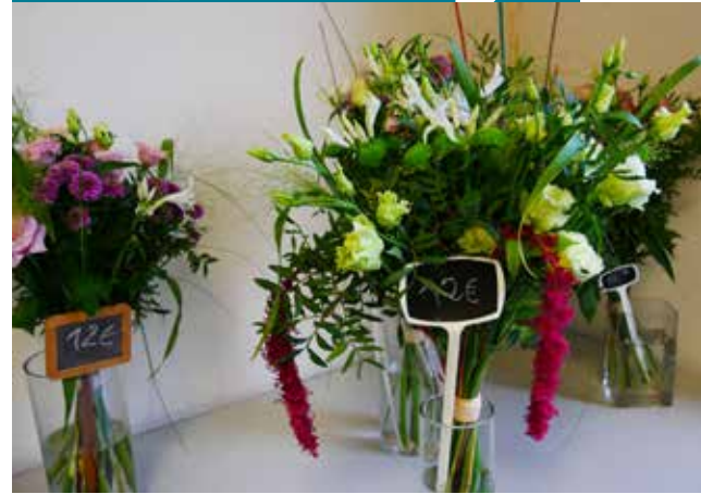
Exemple de production de la section fleuristerie.

LES LYCÉENS DU LP FLORA TRISTAN PROPOSENT AUX CAMBLANAIS ET MEYNACAIS DE PARTAGER AVEC EUX LEUR EXPÉRIENCE ÉDUCATIVE ET PROFESSIONNELLE : LA BOUTIQUE DE FLEURS ET LE RESTAURANT D'APPLICATION SONT, EN EFFET, OUVERTS TOUTE L'ANNÉE.