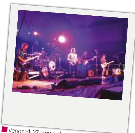
■ Vendredi 27 septembre : festival rock à la salle polyvalente avec les Fortune Tellers, le tribute band officiel des Rolling Stones.