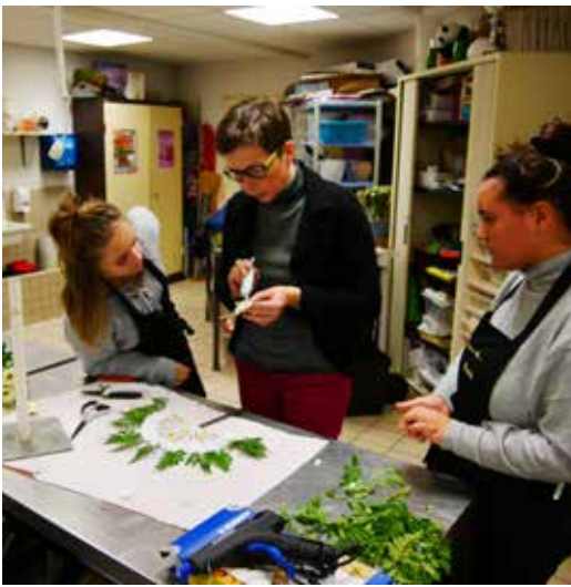
Les jeunes fleuristes en 2 ème année Bac Pro, ici autour de leur professeur, travaillent en binôme sur le langage des fleurs dans le cadre de la création d'un éventail. Une réalisation qui fait suite à la visite des élèves au musée des Arts Décoratifs de Bordeaux.

L e lycée professionnel Flora Tristan de Camblanes et Meynac se situe dans le top 10 des lycées de la Nouvelle-Aquitaine. Plusieurs filières ont d'ailleurs eu 100% de réussite aux examens finaux l'an passé. La réussite éducative des 450 lycéens est la priorité de l'équipe enseignante, composée souvent de professeurs chevronnés.