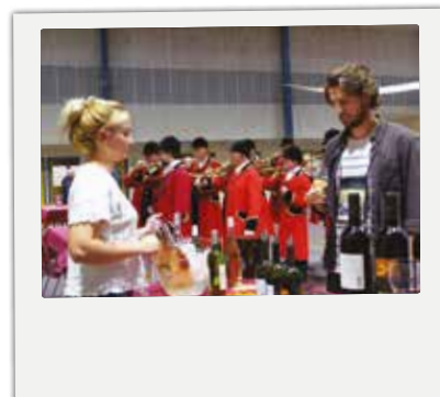
■ Vendredi 18 octobre : fête du vin de Camblanes et Meynac. Une nouvelle édition réussie avec plusieurs centaines de visiteurs. En arrière plan, les Trompes de Chasse des "Veneurs d'Épernon".