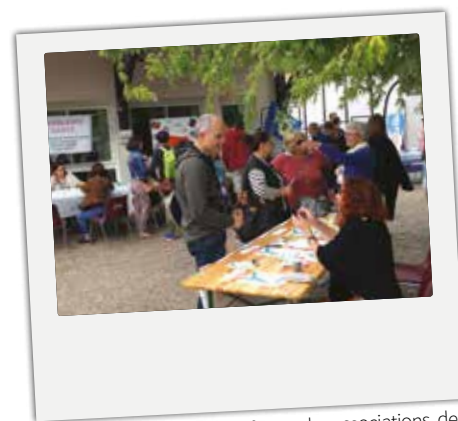
■ Samedi 7 septembre : forum des associations, des artisans, des commerçants et des viticulteurs.