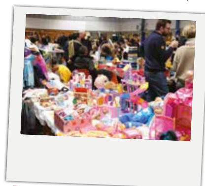
■ Samedi 16 novembre : Bourse aux jouets, organisée par la P'tite Récré dans la salle polyvalente !