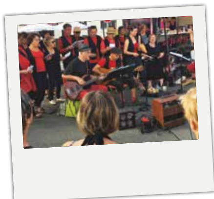
■ Samedi 14 septembre : les Choraleurs lors du 5 ème anniversaire de la création du marché hebdomadaire.

Retour en images sur les temps forts du dernier trimestre.