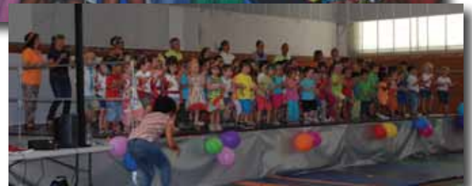
Kermesse de l'école maternelle.