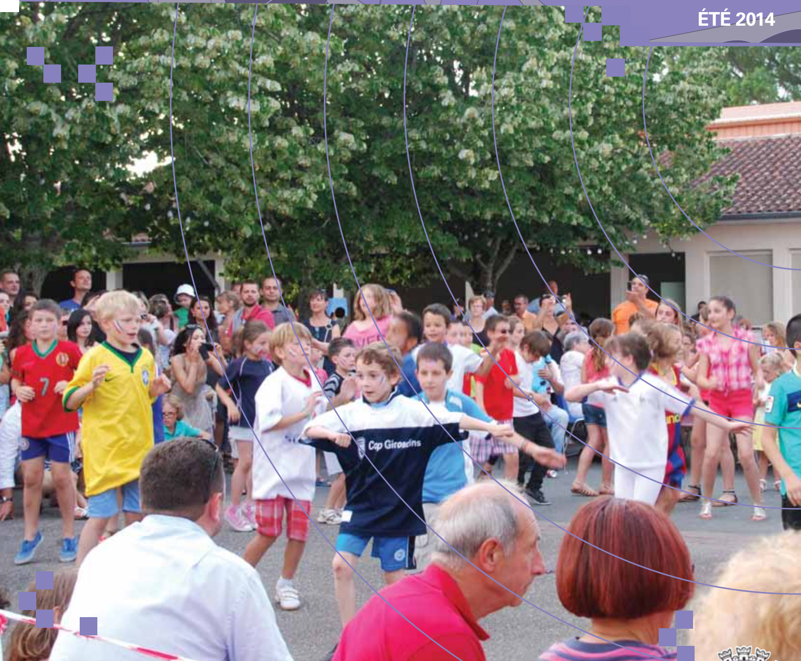
Kermesse de l'école élémentaire.