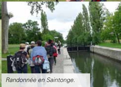
Randonnée en Saintonge.