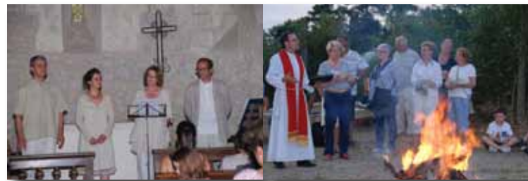
Le feu de la Saint-Jean à Meynac. / Chorale et bénédiction du feu.