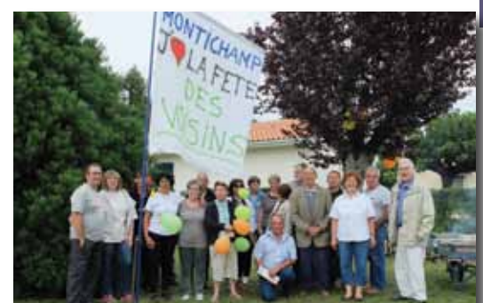
Repas de quartier à Montichamp.