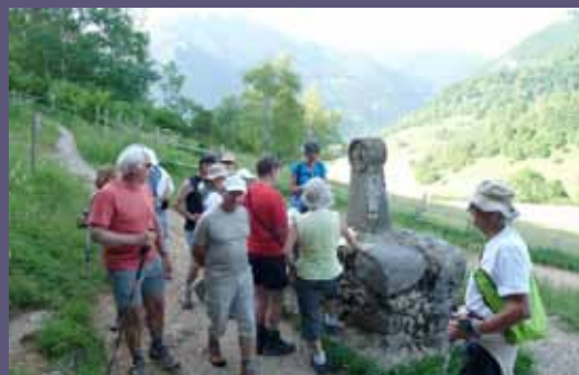
Randonnée en pays Cathare.

N'hésitez pas à laisser vos commentaires ou suggestions. Ils seront les bienvenus. A bientôt !