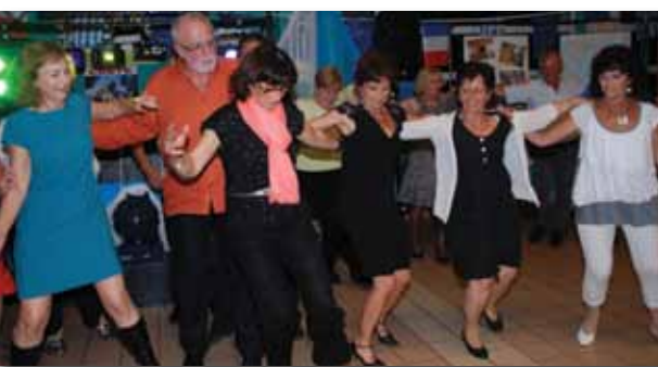
Le sirtaki !