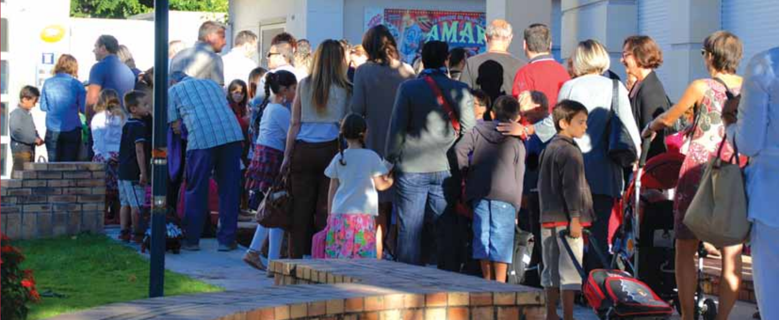
Scène de vie quotidienne de la rentrée scolaire 2013 à Camblanes-et-Meynac.