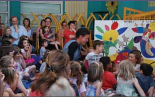
Petit bleu, petit jaune, spectacle des 8 Jours pour l'Art.

Retour en images sur des événements qui se sont déroulés sur la commune ces dernières semaines.