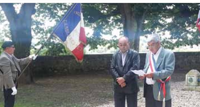
Cérémonie du 14 juillet.