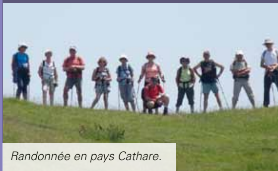
Randonnée en pays Cathare.