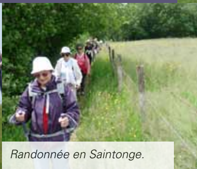
Randonnée en Saintonge.