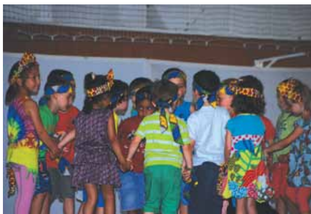
Kermesse de l'école maternelle 2014.