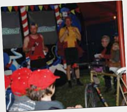
■ Le Vélodrome, Festival Entre 2 Rêves, le 21 mars.

Retour en images sur les temps forts du dernier trimestre.