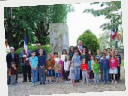
■ Cérémonie du 70ème anniversaire de l'armistice du 8 mai 1945 avec les enfants des écoles et les membres de l'association des anciens combattants.