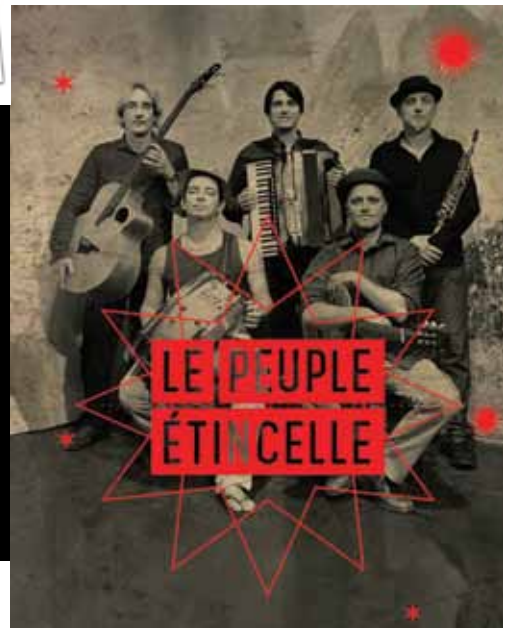
Le peuple étincelle.