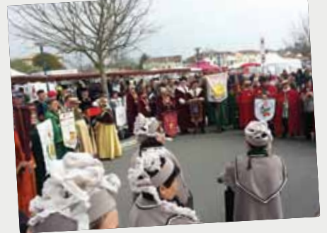
■ Les confréries place du marché, le 21 mars.