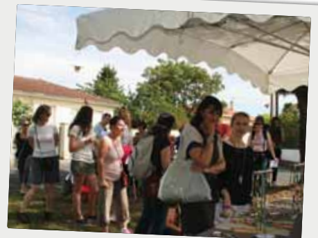
■ La fête de la bibliothèque le 31 mai.