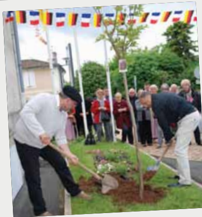
■ Plantation de l'arbre par les deux maires, le samedi 17 mai.