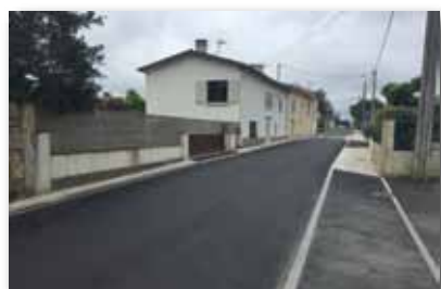
La route de Morillon, entièrement refaite et dont les travaux se sont terminés cette année.

L'anticipation de cet événement a permis de limiter les dépenses et ainsi garder le budget 2015 en équilibre, avec même un léger excédent. ■