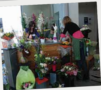
■ Journée Portes Ouvertes au Lycée Flora Tristan, le 19 mars.