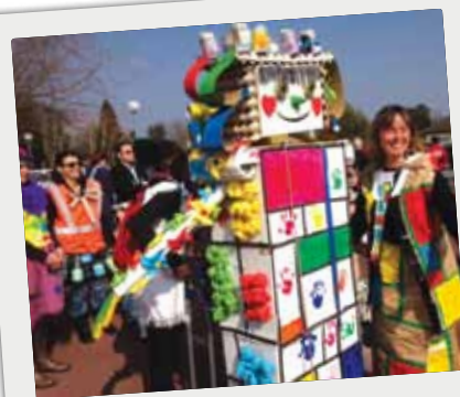
■ Défilé du Carnaval dans les rues de Camblanes et Meynac, le 12 mars.

Retour en images sur les temps forts du dernier trimestre.