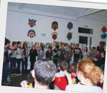
■ Le Printemps des Poètes à la médiathèque, le 25 mars.