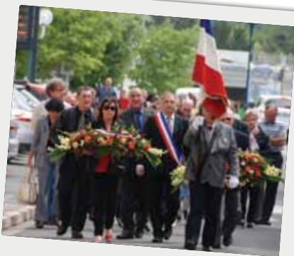
■ Défilé du 8 mai...