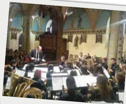
■ Concert de l'orchestre des jeunes musiciens québécois de Vaudreuil-Dorion dimanche 15 mai à l'église Saint-Eulalie de Camblanes et Meynac. Rendez-vous musical proposé par le JOSEM en partenariat avec la municipalité.