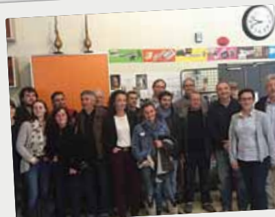
■ Inauguration de Points de Vue, Art et Paysage : Estey de la Jaugue, le 16 avril, dans les locaux d'Handivillage33.