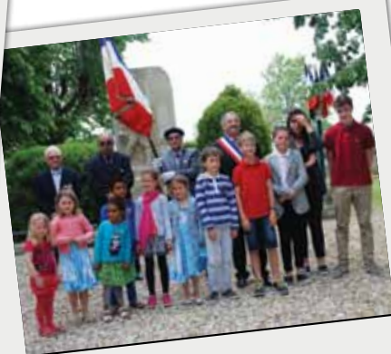
■ ... et cérémonie avec les enfants des écoles de Camblanes et Meynac.