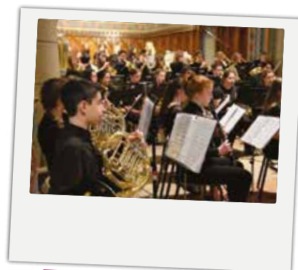
■ Les jeunes musiciens québécois de l'Harmonie de Vaudreuil (Québec), lors de leur concert en l'église Sainte-Eulalie, le dimanche 12 mai.