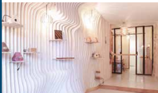
L'agence de menuiserie, rue des Bahutiers à Bordeaux.