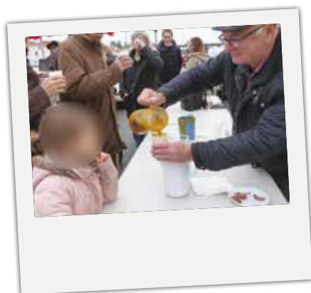
■ Le 26 janvier, la dégustation de soupe proposée dans le cadre du marché du samedi a été grandement appréciée par les enfants comme par leurs parents.

Retour en images sur les temps forts du dernier trimestre.