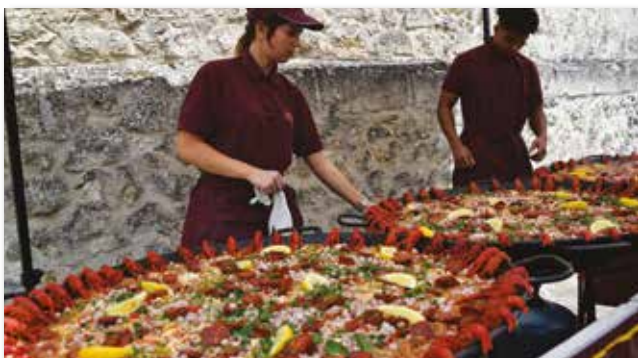
Les organisateurs avaient pensé à tout ! Les festivaliers ont pu se régaler de midi avec un excellent jambalaya. Merci au Comité des Fêtes.