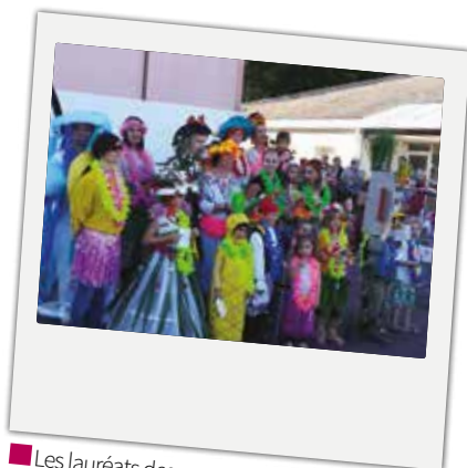
■ Les lauréats des costumes lors du carnaval des enfants, dont le thème cette année était "les îles", qui s'est déroulé le 23 mars sous un magnifique soleil cette année. Félicitations à la directrice de l'école maternelle et à nos ATSEM, elles aussi déguisées.