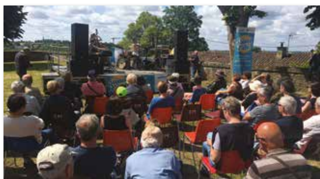
Un public connaisseur et des festivaliers sous le charme du lieu... et du rythme !