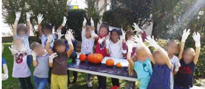
La récolte de graines des citrouilles pour alimenter la grainothèque.

Installé à la bibliothèque, lieu d'échange, de rencontre et de lien social, cet outil permet aux jardiniers amateurs (les