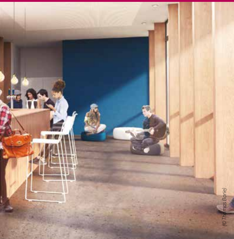
Le hall d'accueil de l'espace culturel, avec la billetterie et le bar.

qui accueille des activités associatives.