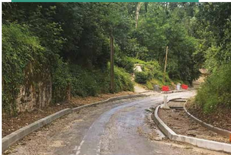
Une écluse en cours de création, côte du Carat.

LES TRAVAUX EN COURS SUR LA COMMUNE VISENT EN PRIORITÉ À SÉCURISER DES AXES MAJEURS ET À FINALISER LES VOIES DOUCES. LE POINT SUR CES CHANTIERS.