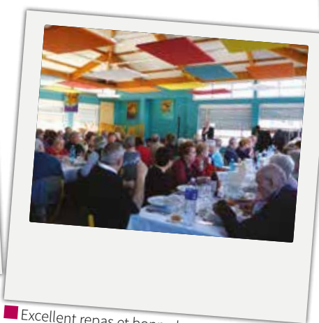
■ Excellent repas et bonne humeur ont fait la réussite de la journée offerte par le CCAS aux seniors de la commune, le dimanche 3 février.