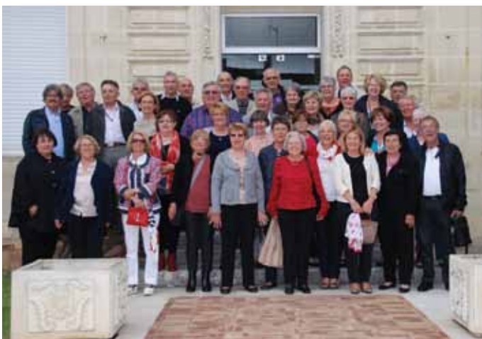
Réunion des anciens élèves de l'école de Camblanes et Meynac.