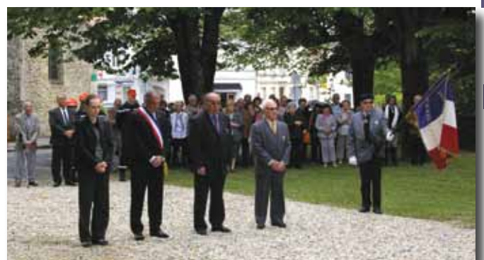
Commémoration du 8 mai 1945.