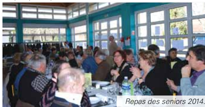
Repas des seniors 2014.

Compte tenu de la situation actuelle, nous ne doutons pas que des nouveaux services, autres que sont la boutique alimentaire sociale, la téléassistance, les repas à domicile seront mis en place au cours de cette mandature pour apporter aide et soutien aux personnes. Chacun fera l'objet d'une présentation particulière. Déjà retenir le 22 juin 2014 : jour du vide grenier auquel participera le CCAS.