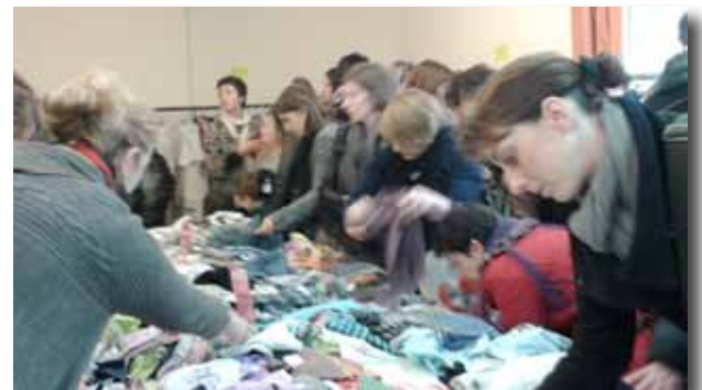
Bourse aux vêtements du mois de mars.