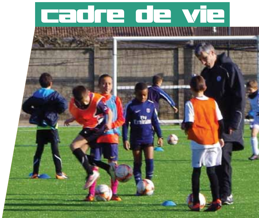
Les premiers entraînements sur le terrain synthétique.

COMME ANNONCÉ DANS LE PRÉCÉDENT NUMÉRO DE MESSAGE, LES TRAVAUX VONT BON TRAIN À LA PLAINE DES SPORTS. LA SALLE DE RAQUETTES EST EN COURS D'ACHÈVEMENT ET LE NOUVEAU TERRAIN SYNTHÉTIQUE EST D'ORES ET DÉJÀ UTILISÉ PAR LE CLUB DE FOOTBALL.