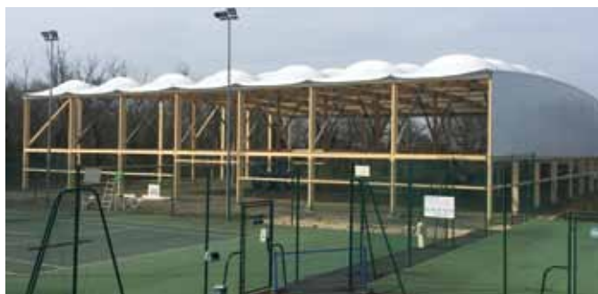
Le gros oeuvre est en cours : installation de la toiture de la salle de raquettes.

Coût de l'équipement, également financé par la CdC des Portes de l'Entre-deux-Mers : environ 600 000 € HT, par l'État à hauteur de 137 000 € et par le Conseil départemental à hauteur de 97 000 €. ■