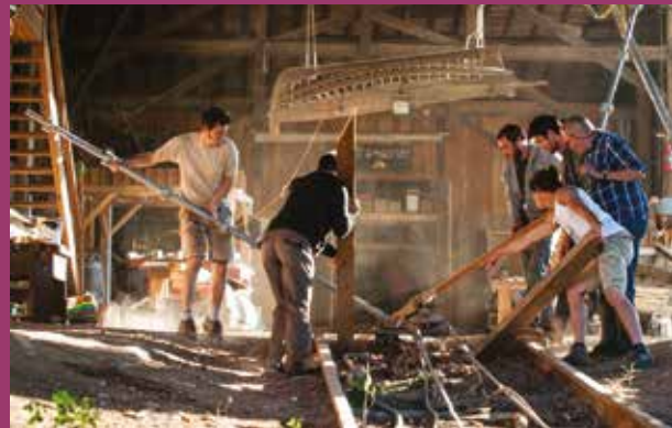
Les Chantiers de Tramasset de la commune de Le Tourne, une association aux multiples projets, travaillant à l'insertion et à la protection du patrimoine.

Le Bocal Local fait partie d'un réseau associatif (le réseau TEMEISSA installé à Camblanes et Meynac) soutenu par le Pôle Territorial Coeur Entre-deux-Mers, qui regroupe notamment les Chantiers de Tramasset à Le Tourne, l'association REV à Camblanes et Meynac, La Boutique Sans Etiquette à Carignan de Bordeaux, les Ateliers détournées/Splendid coworking à Langoiran, la recyclerie Rizibizi à Salleboeuf et T2000 tremplin pour l'emploi à Saint-Quentin de Baron. ■