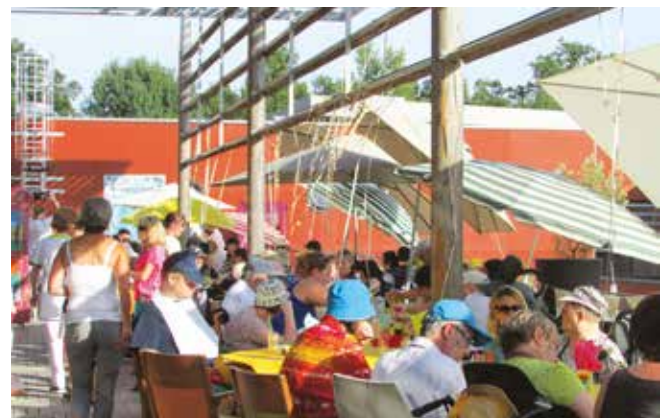
Animation extérieure au Foyer Clary.