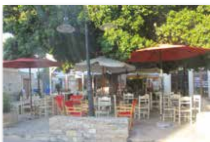
Ci-contre, la vraie place de Vori, en Crète, lieu de rencontres, d'animations et d'échanges lors des visites camblanaises et meynacaises.

Inscriptions à l'accueil de la Mairie Tél : 05.57.97.16.90 ■