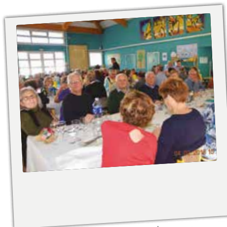
■ Convivialité et amitié, lors du repas des seniors organisé par le CCAS, le dimanche 4 février.