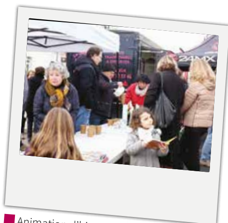
■ Animation d'hiver sur le marché de Camblanes et Meynac le samedi 27 janvier. Une dégustation de soupe préparée à base de légumes de saison très appréciée par les petits et grands !