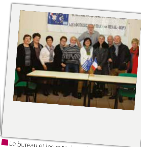
■ Le bureau et les membres du Conseil d'administration du comité de jumelage Camblanes/Vori lors de leur assemblée générale, le vendredi 12 janvier.