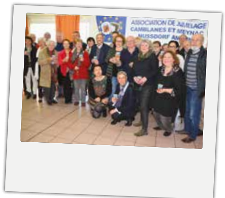
Les participants à l'assemblée générale de l'association de jumelage avec Nussdorf, le samedi 3 mars. ■