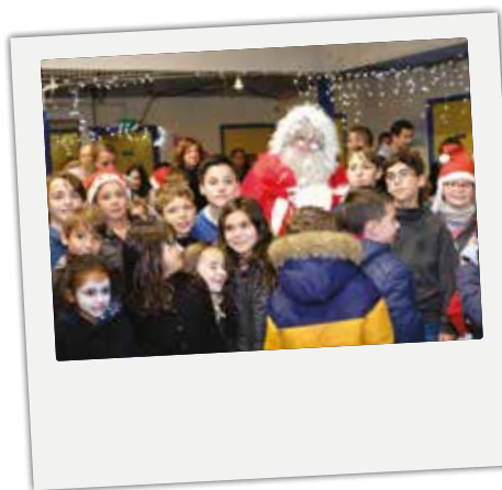
■ Le Père-Noël a rendu visite aux enfants de la commune, le vendredi 22 décembre. Un marché de Noël qui a attiré une nouvelle fois beaucoup de monde.

Retour en images sur les temps forts du dernier trimestre.