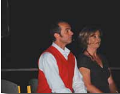
Spectacles de rentrée, samedi 6 septembre.

Retour en images sur des événements qui se sont déroulés sur la commune ces dernières semaines.