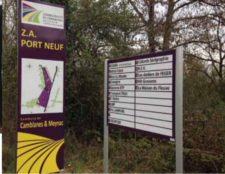
Quelques exemples de la signalétique nouvellement installée à Camblanes et Meynac.