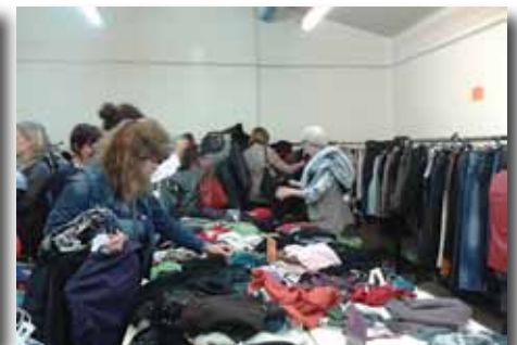
Bourse aux vêtements les 18 et 19 octobre..