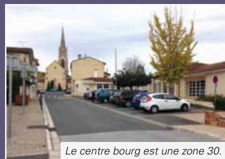
Le centre bourg est une zone 30.

« C'est à chacun d'être responsable de ses actes ! Nous devons respecter les principes de vie en collectivité. La gendarmerie est parfaitement consciente de ces gestes d'incivilités et nous devons tous faire les efforts nécessaires pour que les règles du bien vivre ensemble soient respectées à Camblanes et Meynac, c'est je crois, ce que les habitants sont venus chercher en venant vivre dans notre village » conclut le maire.