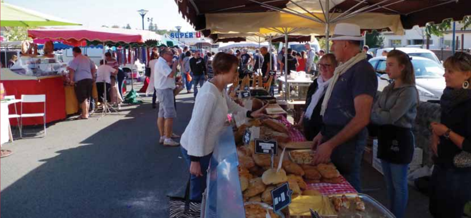
L'étal du boulanger de Camblanes et Meynac est pour le moins appétissant !

déjà plus compliqué. Un marché au coeur du village, ce n'est que du bonus pour notre commune. C'était une de nos promesses de campagne, nous y tenions beaucoup. Il faut que tous participent à sa pérennité» insiste Philippe Guais.