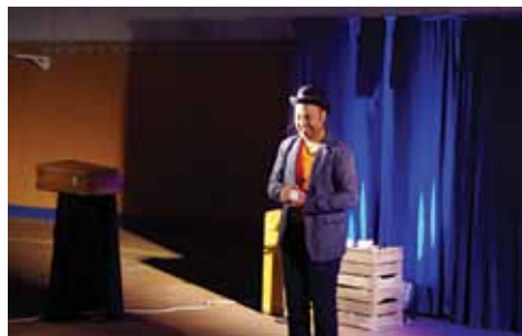
Soirée d'Halloween organisée par l'association des commerçants, le 31 octobre.