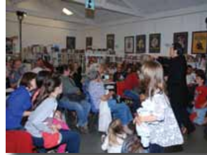
Soirée Auguste Derrière, le 4 octobre à la bibliothèque