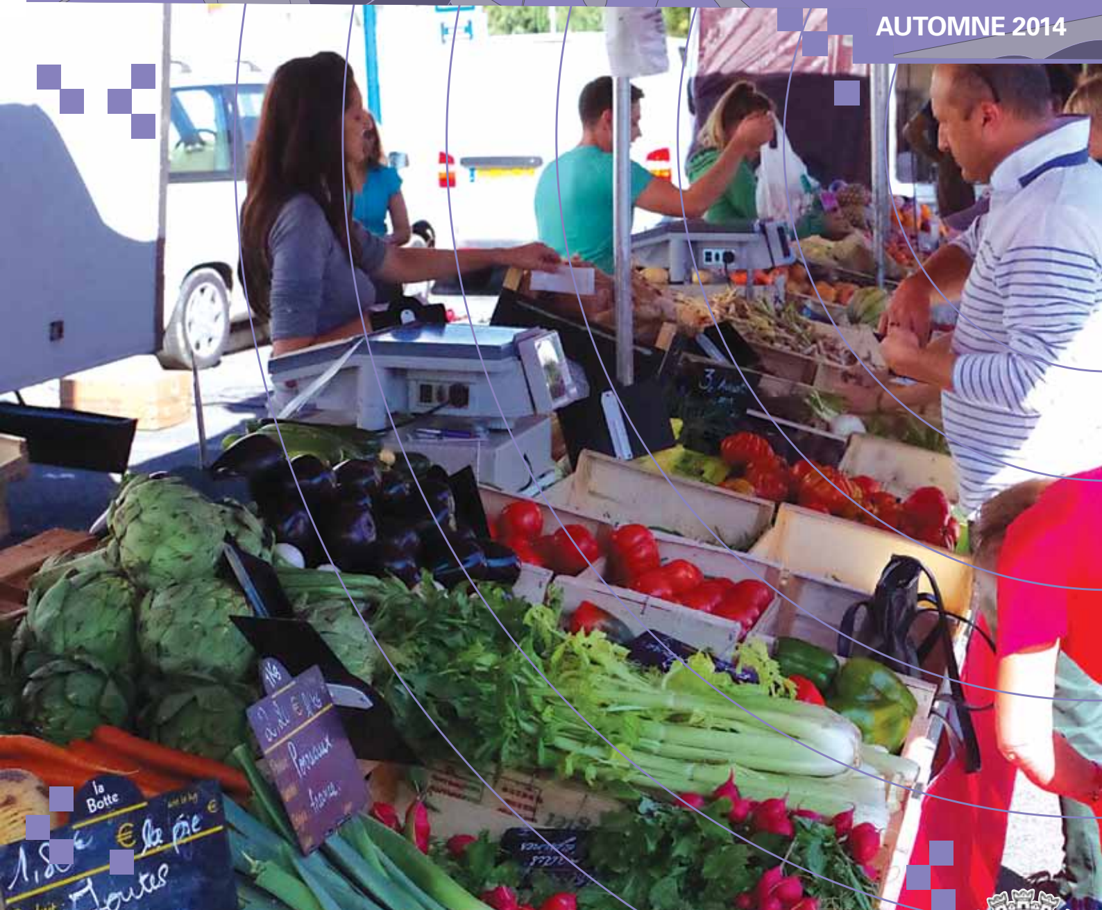
Le marché de Camblanes et Meynac.