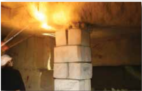
Visite de chantier des carrières sous la route de Morillon, en septembre.