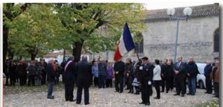
Cérémonie du 11 novembre 2014 avec les jeunes de la commune.