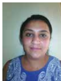
Ines Zayani Arts manuels