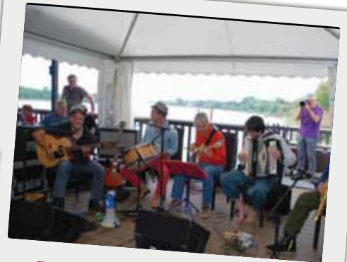
■ Concert à la Maison du Fleuve dans le cadre du festival Jazz360, le 13 juin.