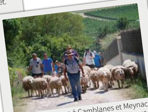
■ Transhumance à Camblanes et Meynac lors de la fête des métiers anciens et sous un soleil de plomb !