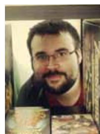
Pierre Charriot Ludothèque