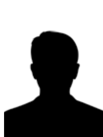
Animateur Activités libres