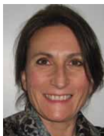
Marie-Laure Leboulanger Médiathèque