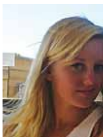
Venaig Péchard Théâtre, marionnettes