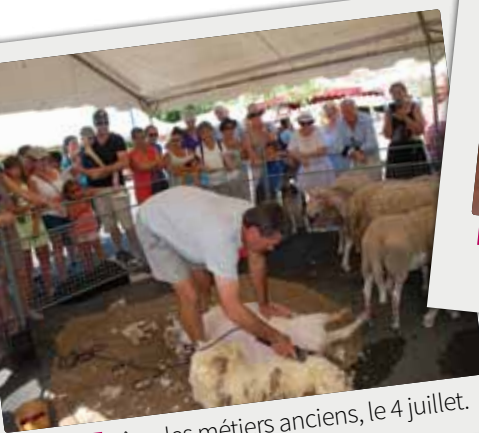
■ Fête des métiers anciens, le 4 juillet.