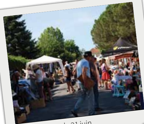
■ Vide grenier, le 21 juin.

Retour en images sur les temps forts du dernier trimestre.