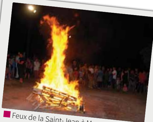
■ Feux de la Saint-Jean à Meynac, le 20 juin, à la chapelle Saint-Panthaléon.