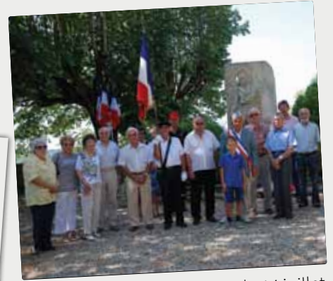
■ Cérémonie du 14 juillet au monument aux Morts.