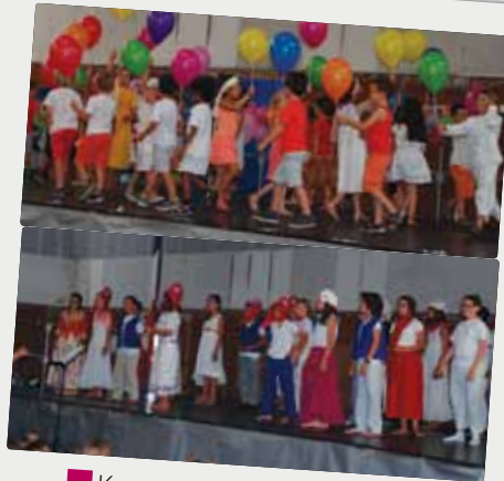
■ Kermesses des écoles maternelle le 19 juin et élémentaire le 26 juin.