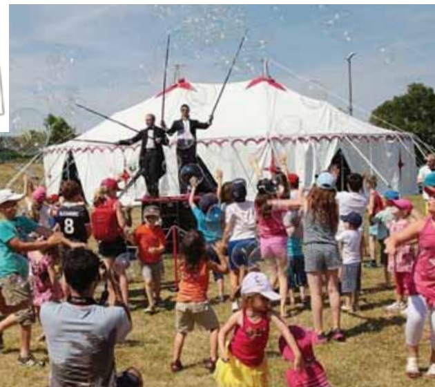
Stand au forum des associations et spectacle de rentrée avec BullOrchestra.

Un samedi 5 septembre à ne pas manquer :