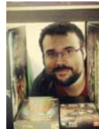
Pierre Charriot Ludothèque