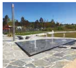
Modèle de fontaine qui sera installée sur l'esplanade.

Le projet de réhabilitation de l'avenue Guy Trupin est en bonne voie. Pour la première phase, la municipalité a travaillé avec l'aide d'une architecte paysagiste à l'aménagement de l'esplanade de la salle polyvalente et de l'école maternelle, qui sera transformée en une véritable place de village, avec des bancs, des arbres, parterres fleuris ainsi qu'une fontaine.