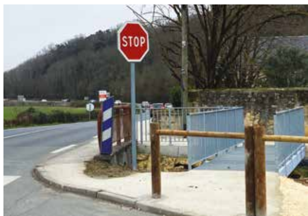
La nouvelle passerelle de franchissement du Rebedech.

Si la majeure partie du chantier a été financée par le Département de la Gironde, la commune a elle aussi participé aux travaux en réalisant une passerelle qui permet de franchir le Rebedech, le pont routier n'étant pas assez large pour poursuivre le cheminement piéton en sécurité.