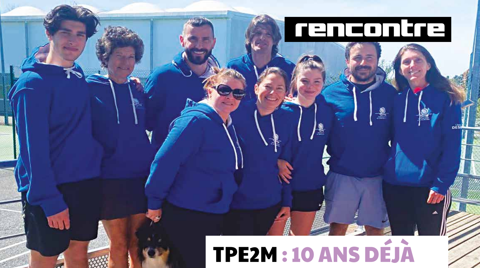
Les joueurs et les joueuses du Tennis des Portes de l'Entre-deux-Mers.