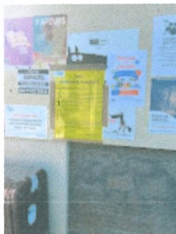
Ecole élem - côté La Poste - 1.jpg 95K