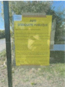
Arrêt de bus Meynac 1.jpg 134K