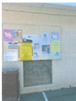
Ecole élem - côté La Poste - 2.jpg 87K