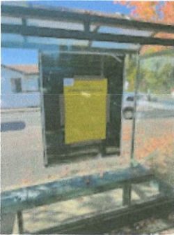
Arrêt de bus Fontbonne 1.jpg 111K