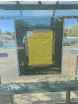
Arrêt de bus Fontbonne 2.jpg 103K