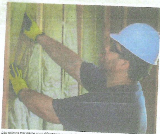
Les primes par geste sont désormais supprimées pour les travaux d'isolation des murs

Après une éclipse de trois mois, la plateforme MaPrimRenov', et une rénovation d'ampleur, vient de rouvrir le 30 septembre dernier. Cet intermédiaire a accouché d'une nouvelle mouture de cette aide versée par l'Agence nationale de l'habitat (www.anah.fr). Les contraintes budgétaires actuelles ont manifestement influencé l'élaboration de cette énième version de la prime. Concernant les rénovations d'ampleur, seulement 13 000 nouveaux dossiers seront acceptés dans le pays jusqu'à la fin 2025 et cela ne concernera que les ménages les plus modestes. Depuis la réouverture, l'aide n'est plus attribuée qu'aux biens les plus énergivores, c'est-à-dire affichant un DPE (diagnostic de performance énergétique) en E, F et G. En conséquence, le bonus de « sortie de passoire énergétique », qui représentait 10 % du montant des travaux, est désormais supprimé. De plus, le plafond de dépenses