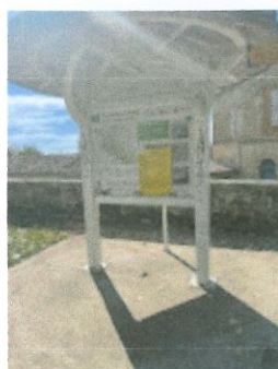
Kiosque Eglise 2.jpg 103K