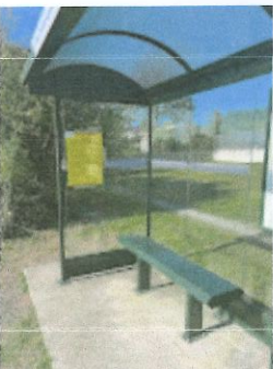
Arrêt de bus Meynac 2.jpg 115K