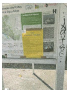
Kiosque Eglise.jpg 117K